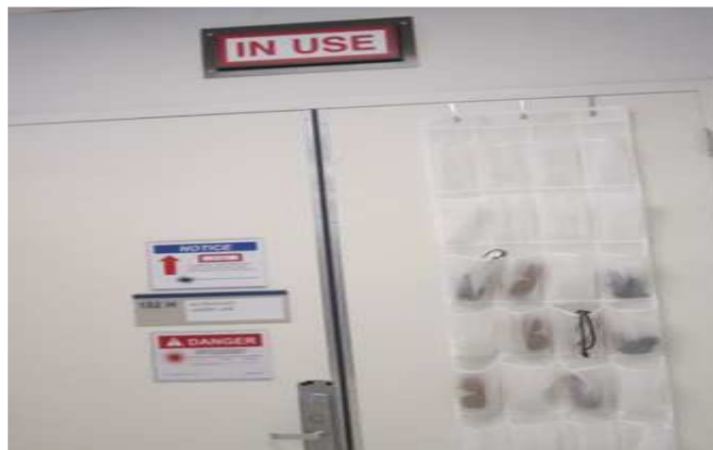
그림 1. 레이저 경고표시

다. 레이저 장비의 작동 중에는“사용 중”, “접근금지”등의 표지를 부착하여 실험자의 사람들의 접근을 금지한다.