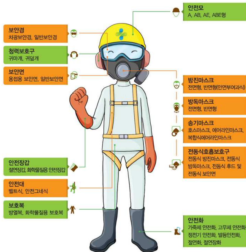
그림 2. 개인보호구